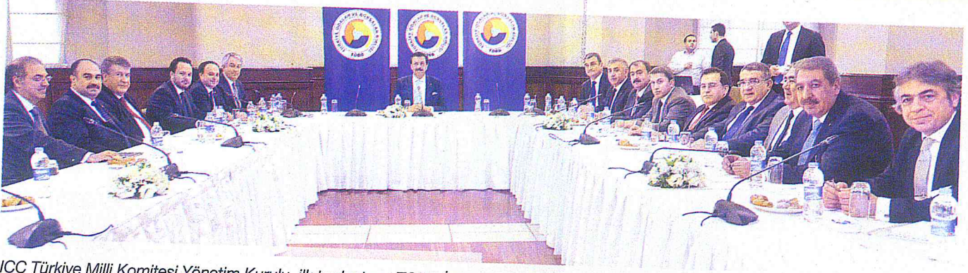
ICC Türkiye Milli Komitesi Yönetim Kurulu, ilk toplantısını TOBB İstanbul Hizmet Binası'nda yaptı. Toplantıda, 2014 projeleri değerlendirildi.