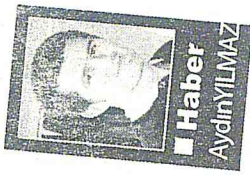
■ Haber Ayçılın/İLMAZ